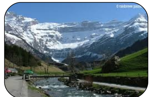
Cirque de Gavarnie