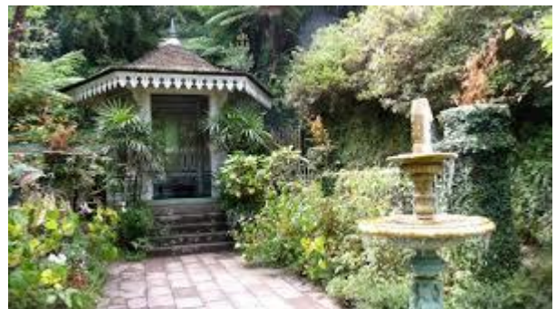
La maison Folio