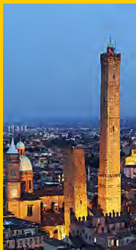
Bologne : les Tours de la vieille ville