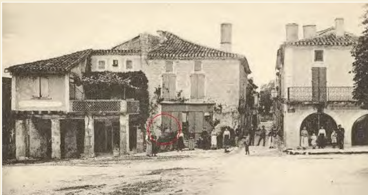
Sur cette carte postale ancienne (début du XX s .) on peut apercevoir le jeune palmier