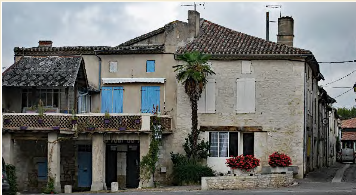
Castelnaud-Montratier, place Gambetta : la maison au palmier et la rue d'Amour