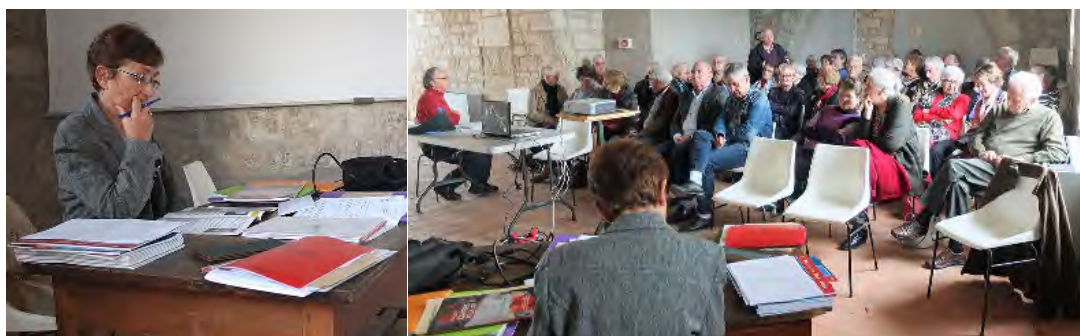
Assemblée Générale A.C.C.C.M. samedi 24 octobre 2015 à Castelnau-Montratier