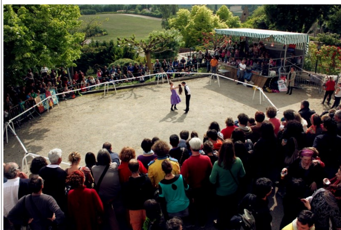
Festival « Saint Paul à la rue » 2013

Nous espérons être nombreuses et nombreux ce jour là ! En attendant, nous vous souhaitons à tous une bonne et heureuse année 2014 !