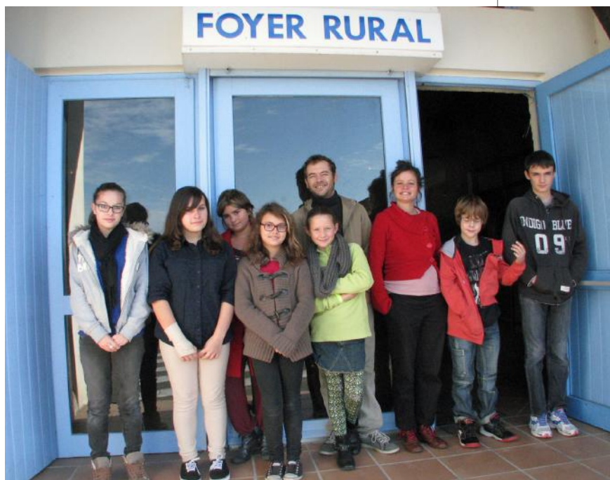
« La Petite Troupe » en route pour une nouvelle saison

En 2015, ces festivités se dérouleront le samedi 1 er août et le dimanche 2.