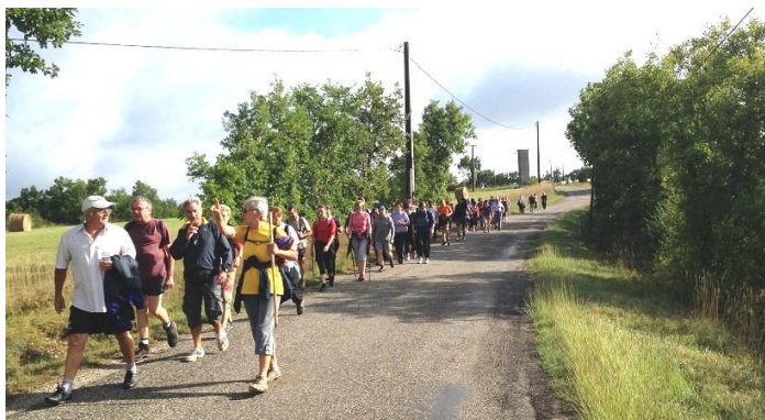
Les Sans-Club Saint-Paulois en rando le 15 août