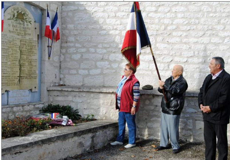
L'hommage aux morts, lors de la cérémonie du 11 novembre

médecin, se trouve heureuse dans son travail malgré une suspicion permanente et un manque de liberté de dire et de faire. Sa mère décède et son père seul vient visiter son frère à Montauban. Atteint par une leucémie aiguë, il ne peut rentrer, sa fille obtient un visa exceptionnel pour le voir à l'hôpital où il décède en 1974.