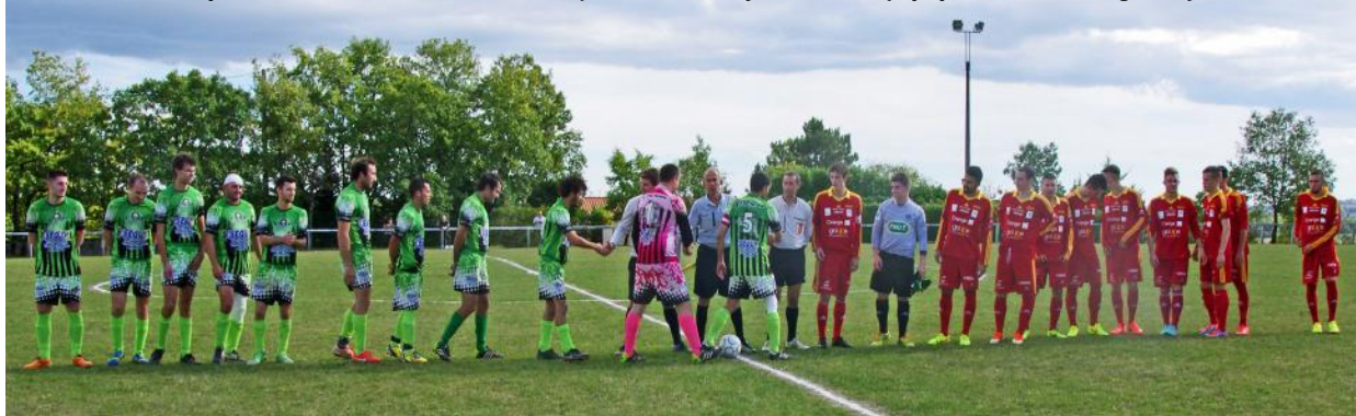
Coupe du Midi 2014-15 : Saint Paul reçoit RODEZ Aveyron Foot II (équipe d'Honneur Régional)