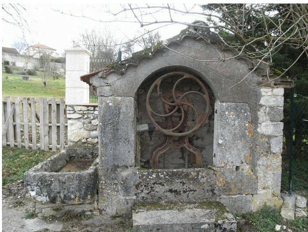
La fontaine ... avant travaux

On ne connaît pas la date de construction de cette fontaine. Ce dont nous avons la certitude : elle existait déjà au lendemain de la Révolution, lorsque les Labouffie ont occupé la mairie ; ils auraient brûlé tous les documents de l'Ancien Régime à la fontaine.