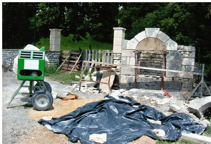
... pendant les travaux de rénovation