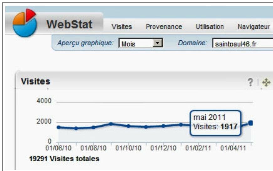
Statistiques des visites du site saintpaul46.fr sur les 12 derniers mois

Sur les 12 derniers mois, le site a reçu près de 20 000 visites, soit plus de 1600 / mois, ou en moyenne plus de 50 par jour . Cela peut paraître bien peu, mais à l'échelle de la commune le chiffre suggère l'intérêt que peut avoir ce nouveau moyen d'information. Alors n'hésitez pas à l'utiliser (et à le faire utiliser par vos connaissances), que ce soit pour vous informer ou pour suggérer vous-mêmes des informations à ajouter.