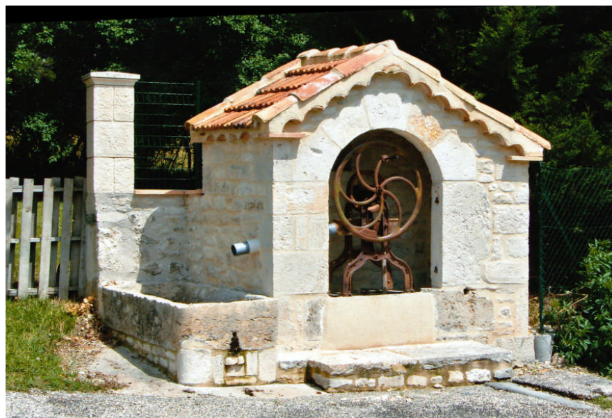
La fontaine rénovée, avec son abreuvoir pour les animaux