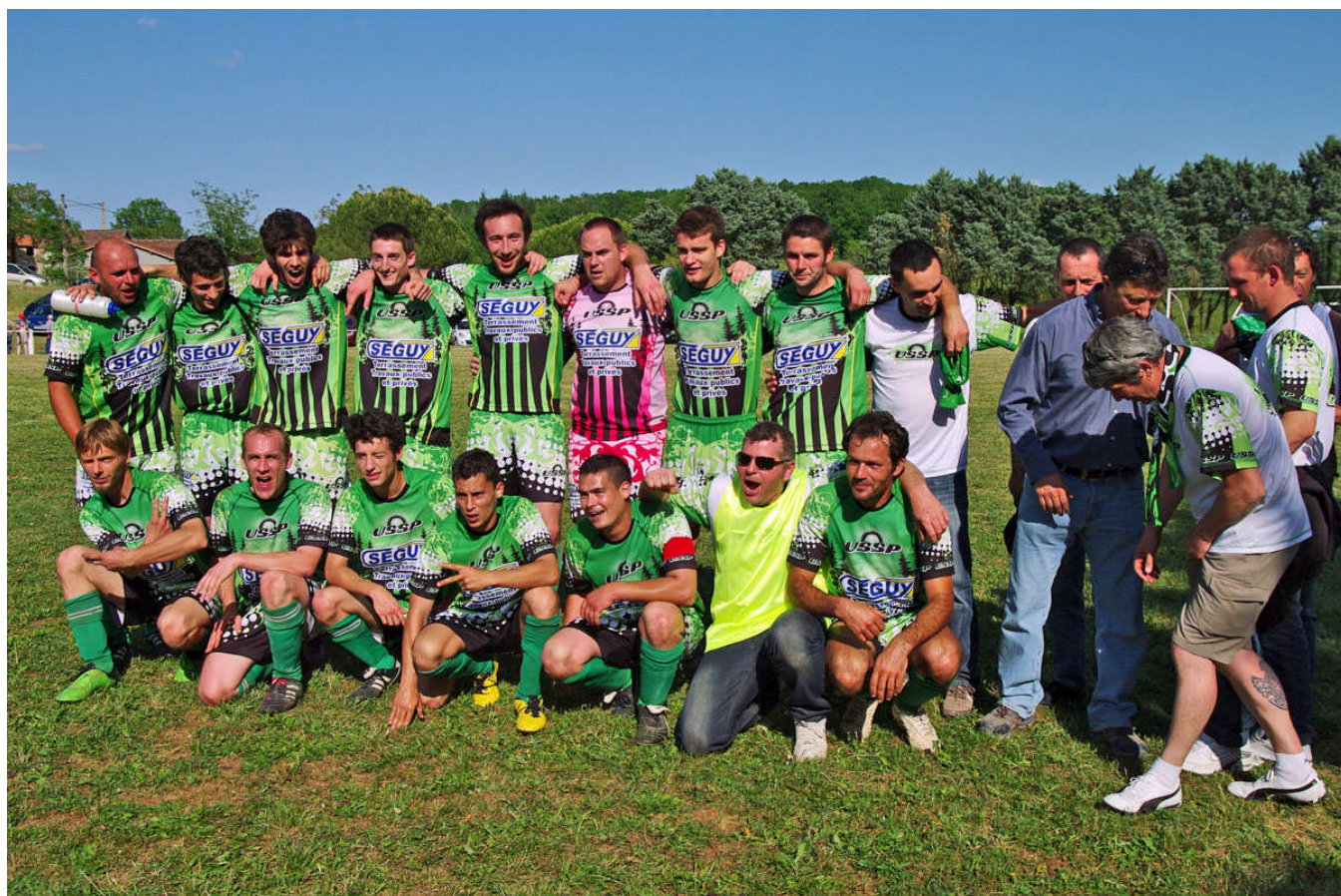
L'équipe championne du Lot 2011 Promotion 1 o division