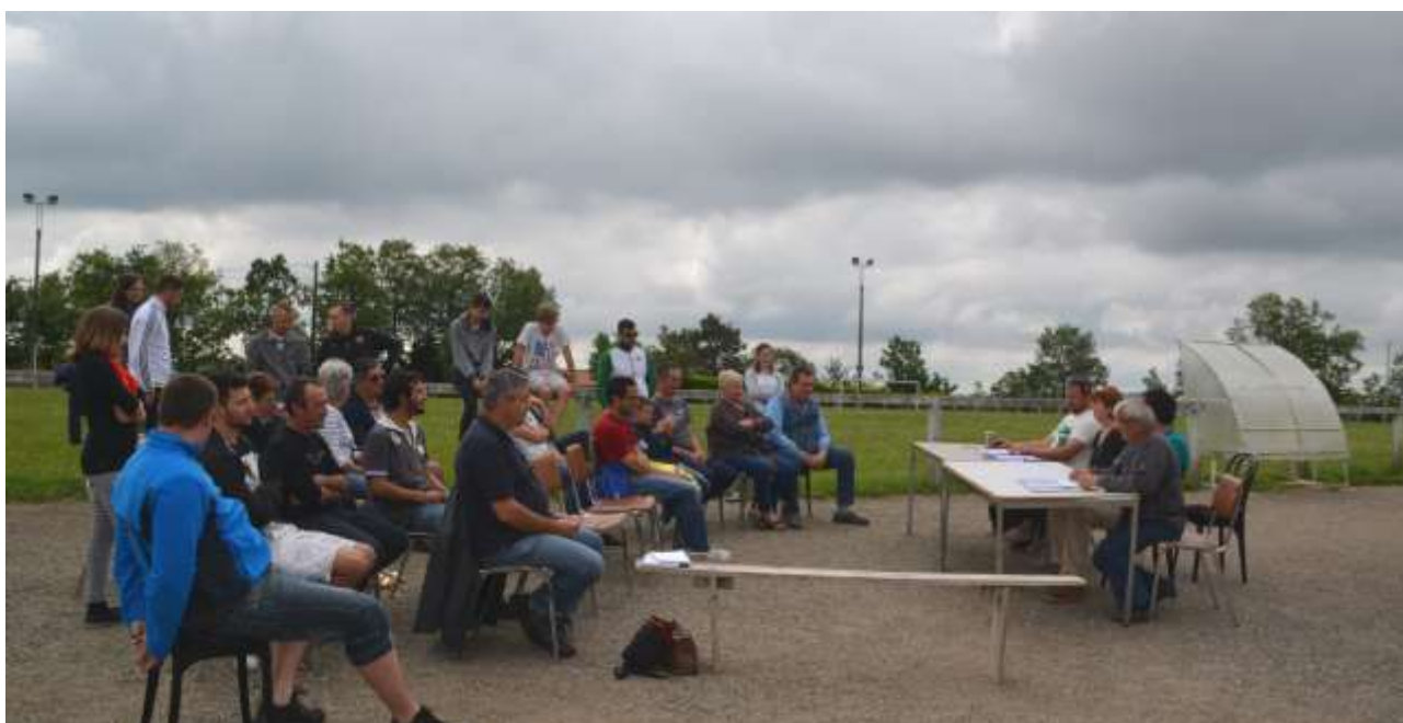
Assemblée générale du club le 4 juin 2016