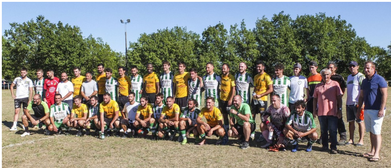
les 2 équipes Saint Paul et Luc / La Primaube

Cette 57ème saison d'affilée débute sur les chapeaux de roue avec une historique qualification pour le 3ème tour de la Coupe de France! Après avoir vaincu Thédillac chez lui puis Ségala Foot (entente Souceyrac/Latronquière) de D1 à domicile le 3ème tour offrait à notre club l'équipe de Régionale 2 de La Primaube qui allait s'imposer logiquement et largement (9 à 0) C'est le 1 er club lotois de 3ème division à atteindre ce tour dans cette compétition et l'équipe méritait bien les longs applaudissements qui ont accompagné la sortie des joueurs pour un souvenir qui deviendra inoubliable!