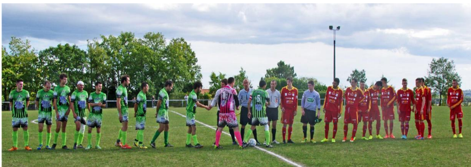
Saint Paul reçoit l'équipe 2 de RODEZ, détentrice de la Coupe de Midi-Pyrénées(12 octobre 2014)

Enfin autre satisfaction, la 2ème place sur 27 obtenue au challenge de la sportivité .