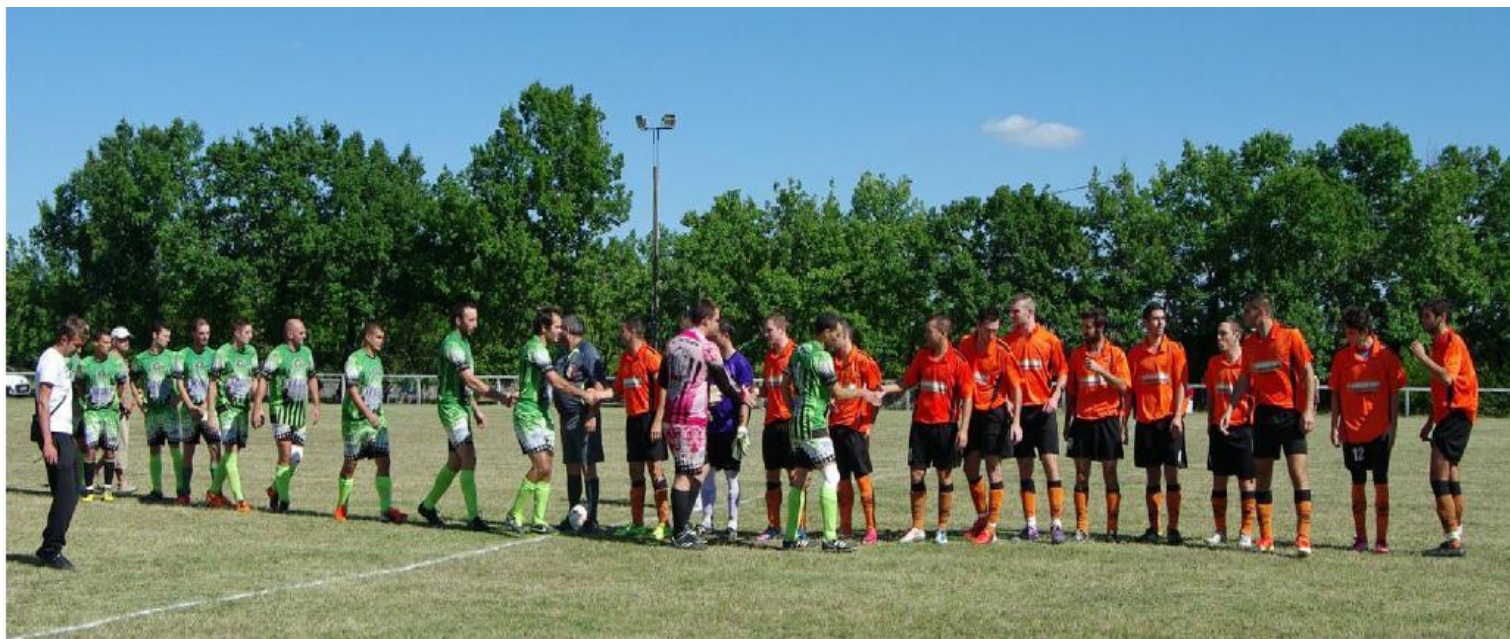
Coupe du Midi 2013-14

En coupe du Midi , belle victoire au 1er tour devant LACAPELLE CAHORS de la division supérieure et ensuite défaite dans les prolongations face au PFC qui allait prendre la seconde place en EXCELLENCE et remporter la BONDOUX.